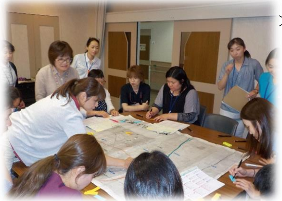
< H30.5.29 北西エリア地域ケア会議 >