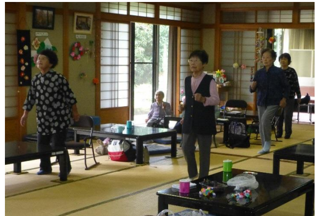
おがっきいのおげんき体操の様子

この活動は悠楽苑の利用者の方々に介護予防について理解し、いつまでもお元気で暮らしていただけるようにという願いから始まった活動で、すでに10年が経過しています。内容は、体操、その時々合った介護予防のお話、レクリエーションなどで、上石津の地域包括支援センター・保健センターで担当させていただいています。