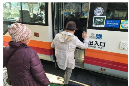
コミュニティバスの中でも楽しくおしゃべり