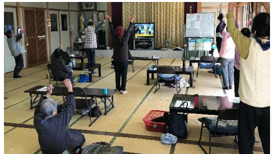
みんなで元気におがっさい体操!

みなさんも“お出かけできる場所”を見つけて、“楽しくおしゃべり”をしてみませんか？！