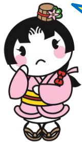
大垣市マスコットキャラクター おあむちゃん