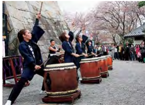
勇壮な墨俣太鼓(昨年の様子)

堤防に咲き誇る約1,000本の桜並木。犀川堤一帯・墨俣一夜城址公園で恒例の「すのまた桜まつり」が3月26日から4月13日まで開催されます。期間中は、ぼんぼりも設置され、やわらかな光に照らし出された夜桜もお楽しみいただけます。