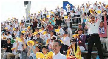
得点に沸く市民応援団(東海地区予選)