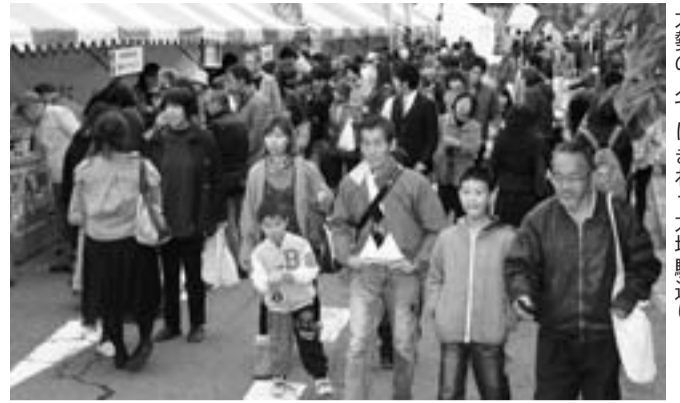
大勢の人でにぎわう大垣駅通り

西濃地域をはじめ、県内外の特産品やグルメが並ぶ「芭蕉元禄大垣楽市・楽座まるごとバザール」が11月15・16日の2日間、大垣駅通り一帯で開催されました。会場には120を越えるテントが張られ、県内の自治体のほか、フレンドリーシティの日置市や奥の細道ゆかりの自治体などが出店。各地の自慢の名物料理や名産品などが販売されました。