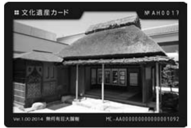
文化遺産カード（表面）