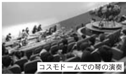
コスモドームでの琴の演奏