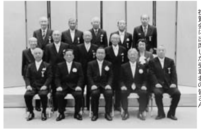
祝賀会に出席した受章者の皆さん

叙勲・褒章を受章された市関係者を祝う祝賀会が12月19日、情報工房スィンクホールで開かれました。