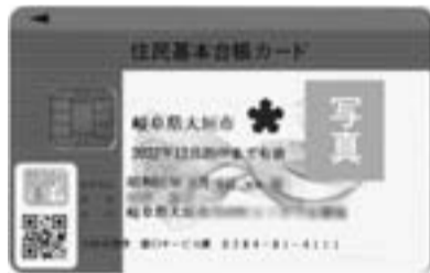
電子証明書は、住基カードのIC機能に登録されています

所得税・地方税の電子申告や登記申請などの行政手続きができる公的個人認証サービス——。