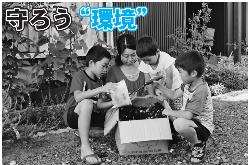
親子でダンボールコンポストに取り組み