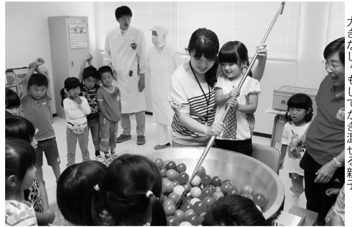
大きなしゃもじでかき混ぜる親子

東幼稚園の園児と保護者が、南部学校給食センターを訪れ、施設見学や調理の模擬体験などをしました。これは、園児が毎日食べている給食は、誰がどこでどのようにして作っているのかを実際に見ることで、調理員をはじめ携わっている多くの人に感謝し、食事の大切さを知ってもらうために行ったもの。