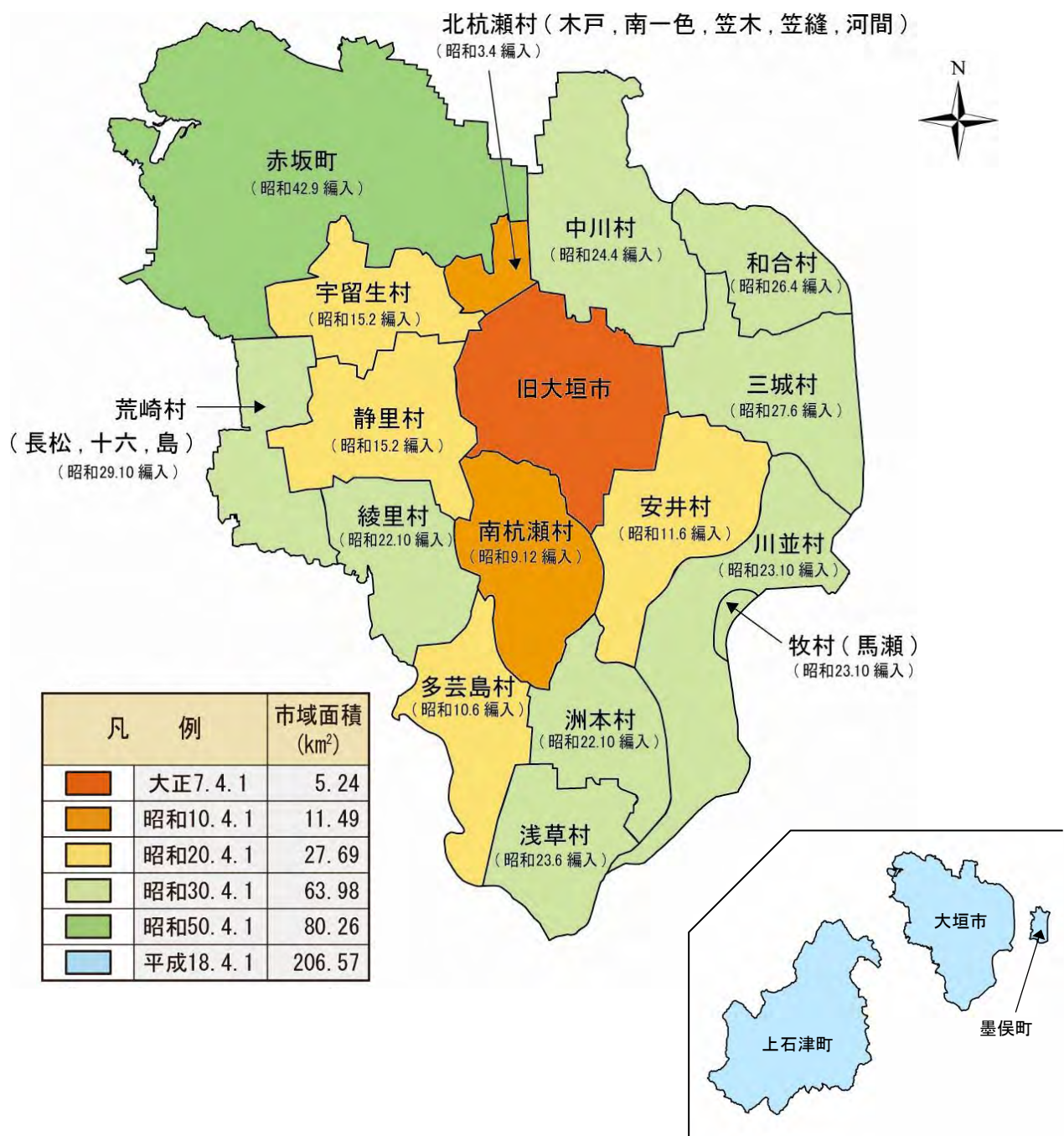
【市域の変遷（旧市町村界）】

大垣地域は大正7年の市制施行後、周辺16町村を編入し、さらに平成18年に上石津町及び墨俣町を編入して、現在の市域を形成しました。