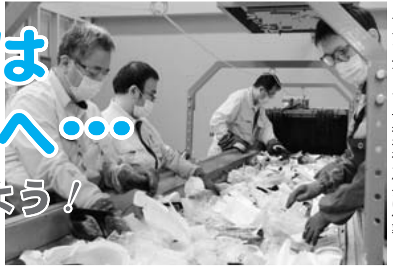
リサイクルセンターで行われる仕分け作業

平成24年4月1日にスタートした「プラスチック製容器包装」の分別収集も、開始から3年半が経ちました。