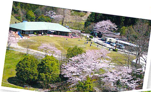
▲四季折々の美しい風景が楽しめます。