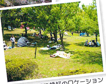
▲アウトドアに絶好のロケーション

ここには自然と語り合う楽しい時間があります。 小鳥のさえずり、木々を揺らすさわやかな風—— おもわず深呼吸したくなる 自然と存分にふれあい 一日中遊べる かみいしづ緑の村公園