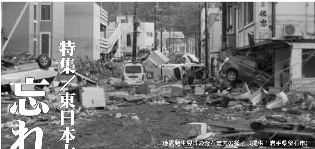
地震発生翌日の釜石市内の様子