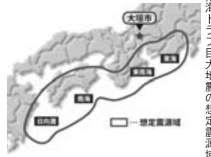
南海トラフ巨大地震の想定震源域

想定される2つの地震について、市内の揺れの大きさを詳細に表した「震度MAP」は、生活安全課で配布の防災ガイドブック、市HPの「大垣市統合型GIS(防災マップ)」をご覧ください。