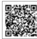
スマートフォン用

また、使用開始・中止する3営業日から1か月前までの期間は、市HPの「水道等開始・中止申込専用ページ」からお申し込みも可能です。