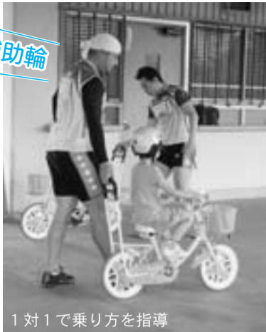
1対1で乗り方を指導

＊対象／自転車に乗ることができない6歳児（平成21年4月2日～平成22年4月1日生まれ） ※保護者同伴