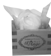
花よりダンジュ *数量限定