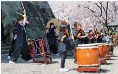
墨俣太鼓(昨年の様子)

詳しくは、同まつり実行委員会(墨俣商工会内、☎62-6283)へお尋ねください。