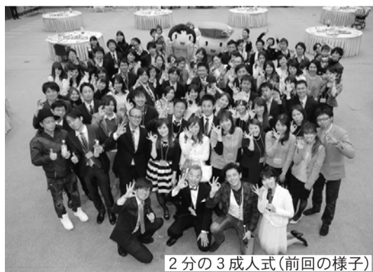
2分の3成人式(前回の様子)

◇2分の3成人式開催事業…就職や結婚、子育てなど、さまざまな変化を経た30歳の節目の年に、人と人との出会いや地域とのつながりを作るきっかけの場を提供するため、「2分の3成人式」を開催する