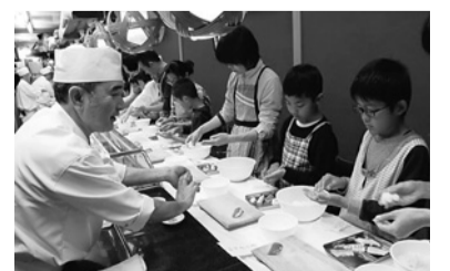
地域の魅力を再発見する「おむすび博」

ほか、かがやき成人学校講座事業／おむすび博開催事業／街のアーティストフェスタ事業／ツール・ド・西美濃開催事業／市民農園ふれあい事業／障害者就労相談支援事業など