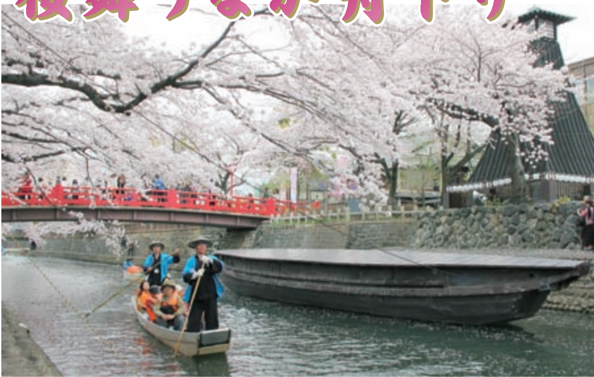
△満開の桜をくぐる水門川舟下り