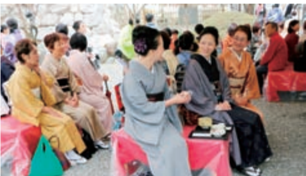
お抹茶を楽しむ着物姿の参加者ら

この週末は、ちょうど桜が見ごろとなり、参加者は花見も満喫しながら、木枡スタンプラリーや市民俳句まつりなど多彩なイベント