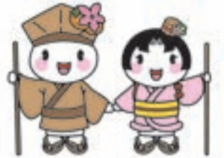
市マスコットキャラクター おがっきい&あおむちゃん