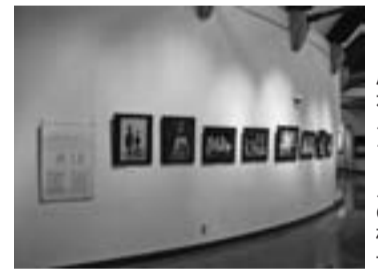
展示スペースの様子