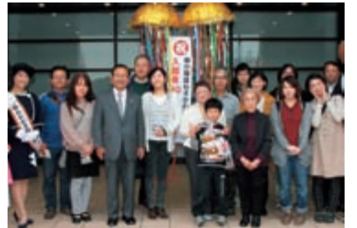
昨年11月の90万人達成の様子