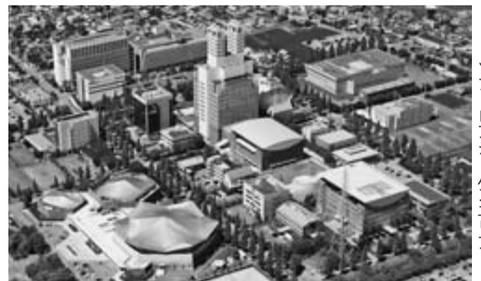
情報関連企業などが集積する