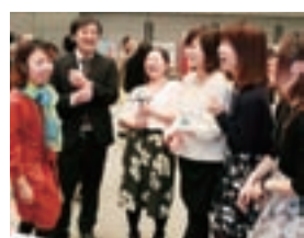
談笑する参加者ら

今年1月未に行われた「2分の3成人式」では、30歳の代表で構成する実行委員会により、約100人の男女が参加して交流を深め、新たな出会いもありました。また、先輩からのメッセージコーナーでは、私から「30代は知力・体力・経験が充実した、一番活躍できる年代。自分の目標に向かって力強く前進してほしい」とお伝えしました。