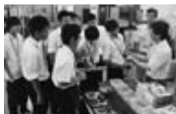
ものづくり企業の見学