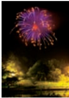
もんでこ花火大会(昨年の様子)