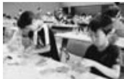
工作キットの組立