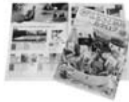
ふるさと納税カタログ

また、ふるさと納税を通して、地元特産品などをあらためて市民の皆さんにも知っていただくことで、さらなる地域振興や魅力発信につなげるため、返礼品の贈呈対象者を市内在住者にも拡大します。いずれも7月1日から開始します。