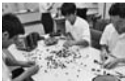
組立ブロック研修