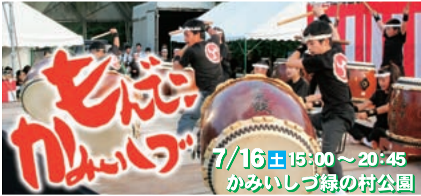
もんでこ太鼓の演奏(昨年の様子)