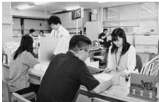
業務の様子（窓口サービス課）