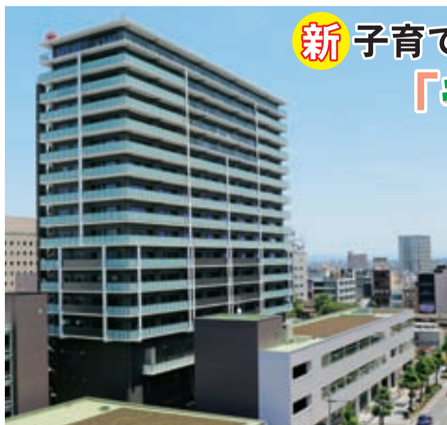
工事が進む大垣駅南街区再開発ビル(17階建のビルが北棟)