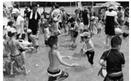
特設プールで水あそび

→館内コーナーの全スタンプを集めた人を対象に、白くまアイスやさつまあげなど鹿児島市の特産品が当たる抽選会