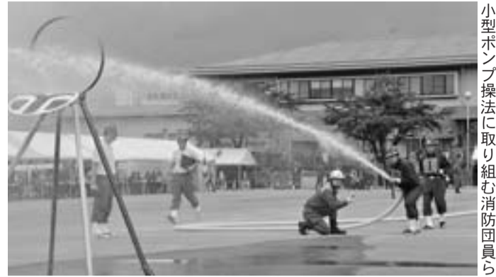
小型ポンプ操法に取り組む消防団員ら