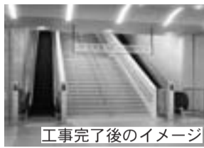
工事完了後のイメージ

市は、大垣駅南口階段部分に下りエスカレーターを新設し、既存の上りエスカレーターの取り替え工事を行います。