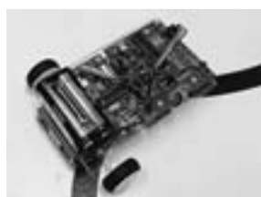
マイコンカーを走る