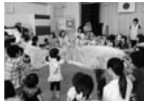
子育てサロンの様子

未就学児とその保護者を対象に、親子で工作をしたり、体を使って遊んだりして楽しむ「子育てわくわくファミリー講座」を開きます。