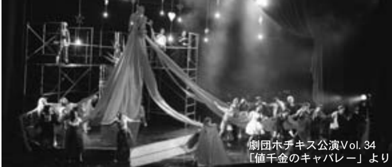
劇団ホチキス公演Vol. 34 「値千金のキャバレー」より