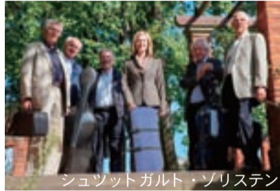
シュツットガルト・ゾリステン