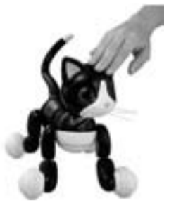
芸をするロボット