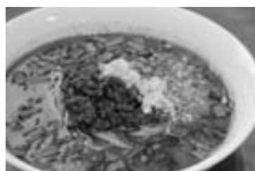
第3回最優秀賞 タンタン麺