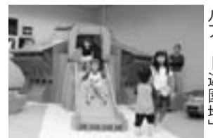
企画展「スイトピアセンター」