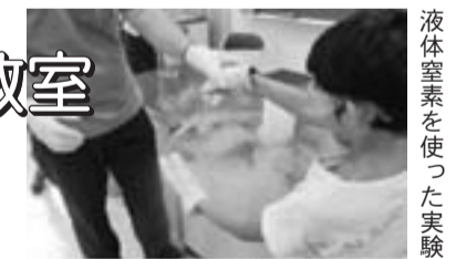
液体窒素を使った実験