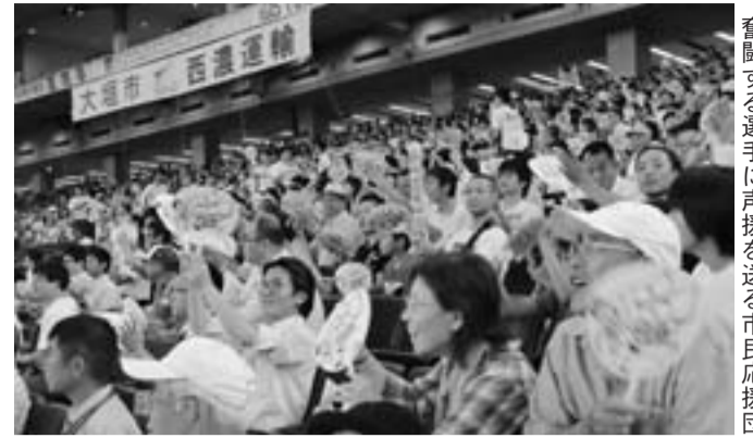
奮闘する選手に声援を送る市民応援団

第87回都市対抗野球大会に、大垣市代表として西濃運輸硬式野球部が出場し、東京ドームで熱戦を繰り広げました。