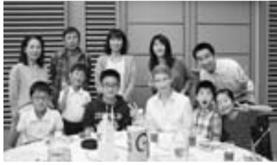
訪問団歓迎会の様子