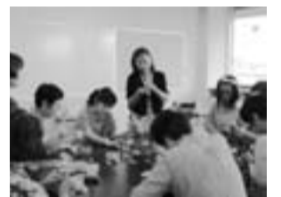
クレイ（樹脂粘土）を使ったブローチ作り（昨年の様子）