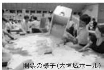
開票の様子(大垣城ホール)

国や地域の将来像を決めるのは皆さんです。今後も投票に行き、私たちの代表にふさわしい人を選びましょう。