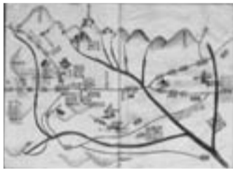
「古文書 関ヶ原合戦の図」