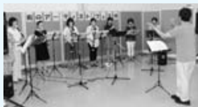
リコーダー演奏（昨年の様子）

生涯学習や市民活動のきっかけづくり、成果発表の場として開催している「街のアーティストフェスタ」。今年度2回目となる今回は、かがやき成人学校の各種講座で学ばれた皆さんの発表会を行います。ぜひ、お気軽にご来場ください。