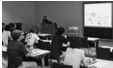
かがやき市民手づくり協働事業「街なかの空き家を再生して大垣を活性化するプロジェクト」