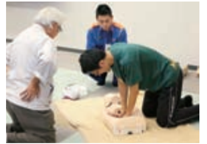
すばやい心肺蘇生が救命のカギ

＊その他／動きやすい服装で参加し、昼食は各自持参。全課程を修了し効果測定に合格した人には認定証を交付