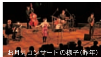
お月見コンサートの様子(昨年)