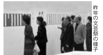
昨年の文芸祭の様子