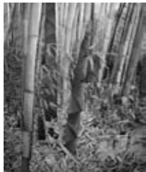
【日本画】「竹林の春」川瀬美津子