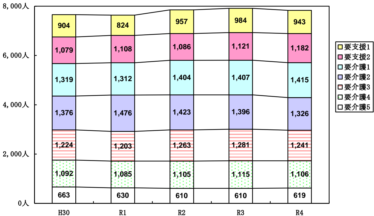
【図-2】 介護度別認定者数の推移