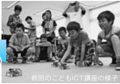
前回の子どもICT講座の様子

夏休み期間中、大垣市情報工房を中心に、ICTのおもしろさを体験することができる講座を多数開催しています。ぜひご参加ください。