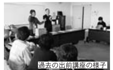
過去の出前講座の様子

県内でも詐欺件数が非常に多い大垣市。定番から最新の詐欺手口、その予防策や講座、相談できる窓口などを紹介。