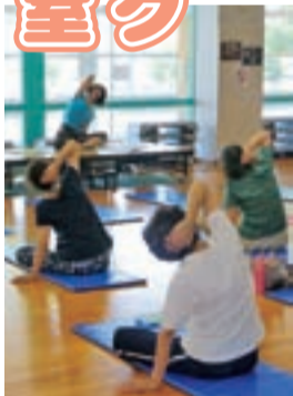
気持ちよく汗を流す受講者