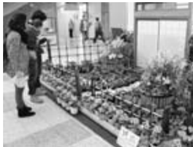
花飾りを見る来庁者(過去の様子)