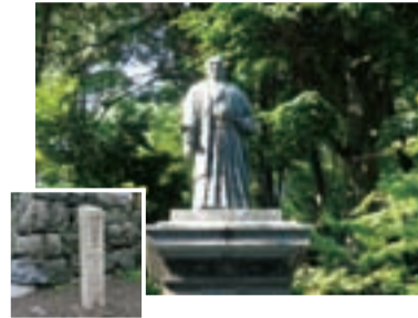
▶金森吉次郎の像(郭町)