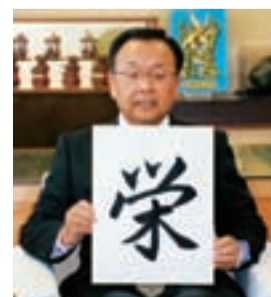
今年のテーマの漢字「栄」

また、未来の大垣を描いたアニメ映像を上映し、幅広い年代に楽しんでいただきます。その他、文化・スポーツなど各分野にわたって、市民提案事業を含めた市民総参加の100周年記念事業を行いますので、皆さん一緒に盛り上げていきましょう。