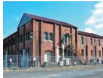
▶イビデン株式会社西大垣変電所(西崎町)