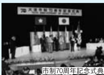
市制70周年記念式典

また、市民が一堂に会し大合唱をした市民のつどいや軽スポーツに汗を流した市民総合体育大会、日韓サッカー親善試合など各種記念行事が多彩に繰り広げられました。