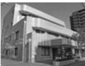
急患医療センター

*とき/日曜・祝日・12月29日～1月3日・8月15日 午前9時～正午、午後1時～5時 *ところ/恵比寿町南7-1-14、☎81-6540