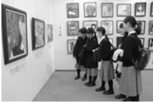
作品を鑑賞する学生