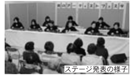
ステージ発表の様子