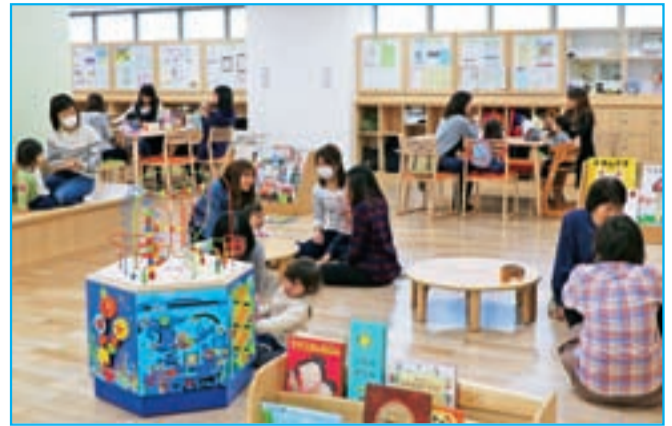
未来の大垣を担う子どもの成長を支援

画」の策定を進めます。なお、未来ビジョンの内容をまとめたリーフレットは、4月に全戸配布を予定しています。大垣市未来ビジョンについてのお問い合わせは、地域創生戦略課(☎47-8216)へ。