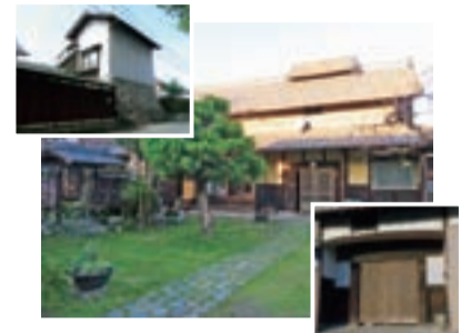
▶奥田家住宅(墨俣町上宿)