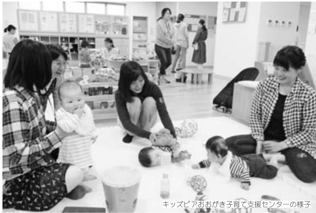
キッズピアおおがき子育て支援センターの様子

子育て全般について詳しくは、子育て支援課（☎47-7064）、各サービスについての問合せ・申込みは各施設、子育てについての悩みごとなどは、子育てなんでも相談室（☎0800-200-7114）へ。