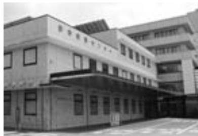
大垣市民病院南側にある救急医療センター

*とき/木・土・日曜日（祝日・12月30日～1月3日・8月15日は除く）午後6～9時 *ところ/南瀬町4-86（市民病院内）、☎81-3341