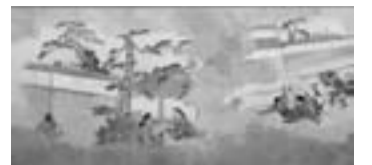
おあむ物語絵巻物

休館日：毎週火曜日と7月18日、8月13日、9月19・26日 入館料：100円 ※高校生以下無料 問合せ：同館（☎75-1231）へ