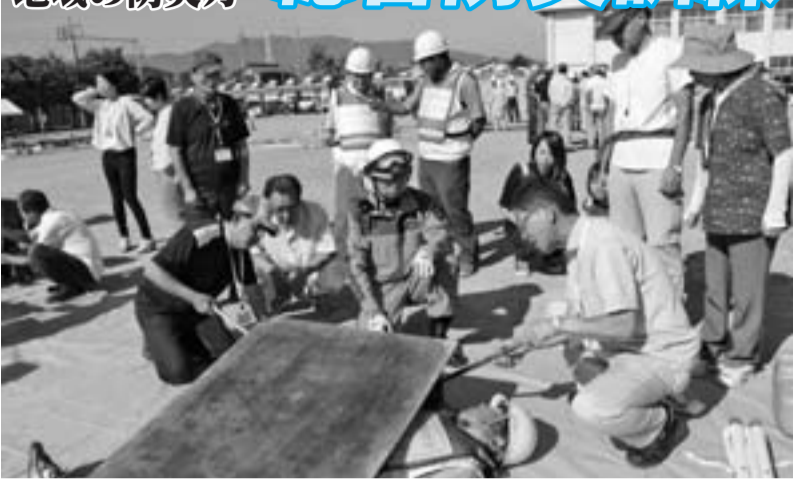
昨年の訓練の様子

市は、市民一人ひとりが災害への対応を身につけるとともに地域ぐるみで防災力を高めるため、毎年、総合防災訓練を行っています。 今年の対象は、日新連合自治会の皆さんです。 ▷とき／8月26日(日) 午前8時～10時 ▷ところ／日新小学校 ▷内容／避難参集訓練、震災時初動訓練(初期消火、救出搬送訓練など)、避難所活動訓練(救援物資の受け取り、給水活動など) ▷問合せ／生活安全課 (☎47-7385) へ