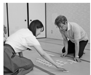
小倉百人一首競技かるたに 取り組む様子

養老鉄道検定や、小倉百人一首競技かるた交流大会など、市制100周年を記念して市民が提案したイベントなどを紹介。