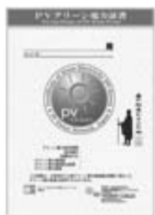
グリーン電力証書