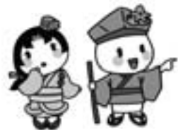
市の資産や負債の額を表しているよ