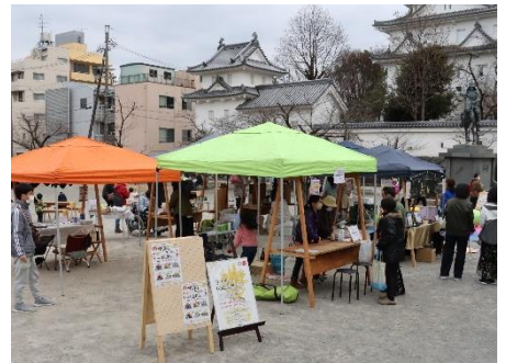
出展体験：まちなかスクエアガーデンでの「アントレマルシェ」の様子