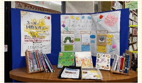
TuLiP(大垣女短ジェンダーについて考えるサークル)が作成した展示物