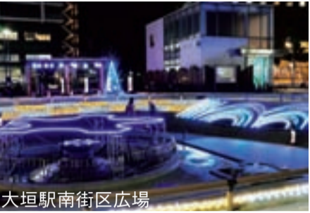
大垣駅南街区広場

市制100周年の特別装飾が行われている大垣駅南街区広場では、足早に家路に向かう人達が足を止め、思い思いに写真を撮っていました。そのほか、