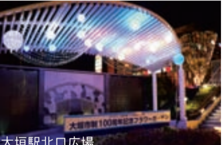
大垣公園 大垣駅北口広場

大垣駅南口・北口広場、駅通りの新大橋などにも電飾が施され、大垣の冬を華やかに照らし出しています。