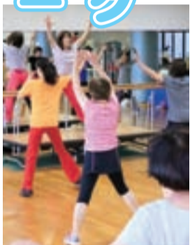
気持ちよく汗を流す受講者