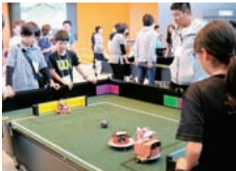
ロボカップジュニアのおおがき予選の様子(5月4日撮影)

子どもたちを対象とした自律型ロボットの世界的競技会「ロボカップジュニア」。その地区予選大会である「大垣市長杯 大垣ノード大会」を、平成31年1月13日(日)に開催します。未来に羽ばたく子どもたちの勇姿を観戦してみませんか。詳しくは、同事務局(G・I・NET内、☎74-8861)へ。