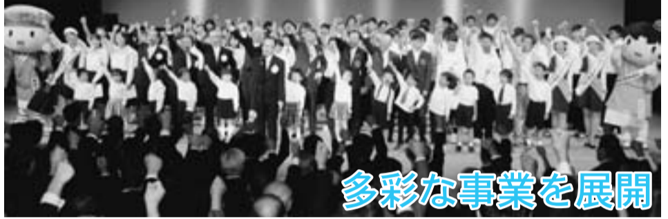
多彩な事業を展開

市制施行記念日の4月1日、オープニングセレモニーで幕開けした市制100周年記念事業。まちへの誇りと愛着を深め、次代を担う子どもたちの夢や希望を育む機会となるよう、多彩な内容で盛り上げてきました。