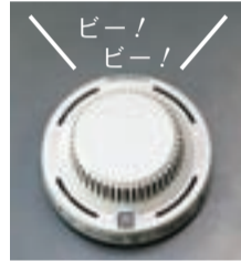
煙を感じると大きな音が鳴ります