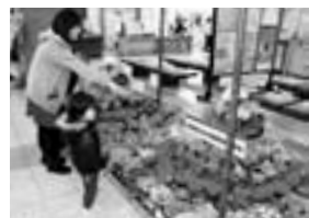
花飾りを見る来庁者(昨年の様子)