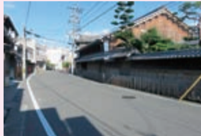
風景資産 ▶中山道赤坂宿の町並み（赤坂町）