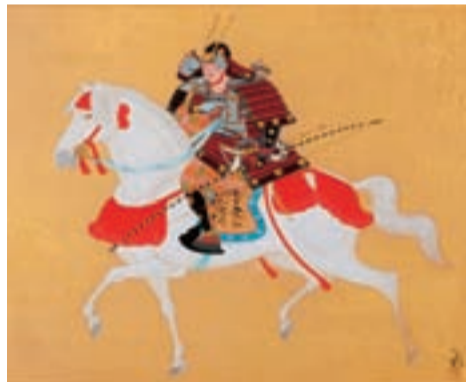
「武将図(個人像)」※初公開