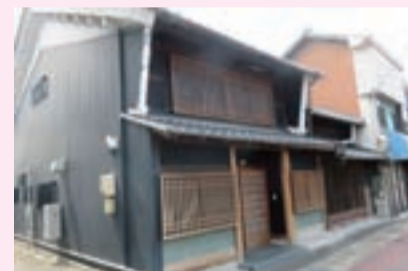
歴史文化遺産 ▶旧万屋染物店（久瀬川町）