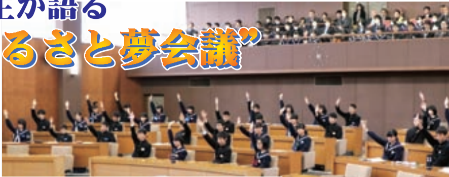
発表された内容に挙手で賛同する生徒ら