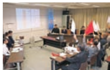
ハイレベルな対戦が繰り広げられた高校生俳句交流大会

これまで90の事業が終わり、2月9日のスマートシティ大垣まちづくり講演会、2月10日のロボカップジュニア岐阜ブロック大会など、3月のフィナーレまでに10事業を予定しています。この記念事業の成果を生かしながら、変化に対応し発展するまちづくりを進めてまいります。