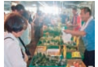
にぎわう会場(過去の様子)