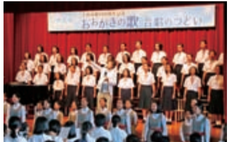
おおがきの歌を披露する中学生ら(昨年7月)