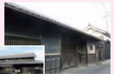
歴史文化遺産 ▶伊藤家住宅（池尻町）