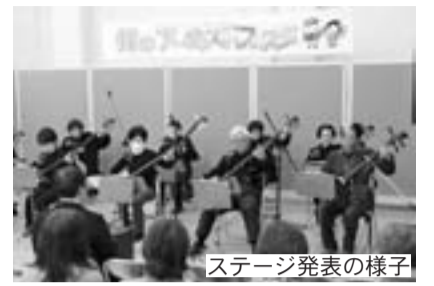
ステージ発表の様子