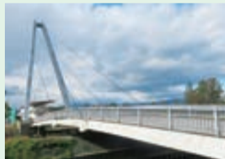
現代資産 ▶アスピックブリッジ（浅中）