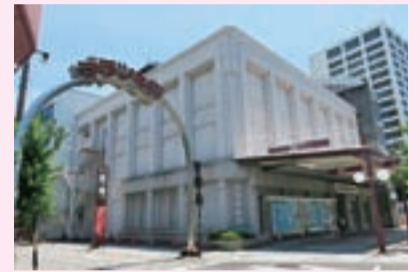
近代遺産 ▶OKB大垣共立銀行郭町ビル（郭町）