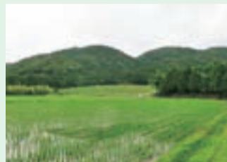
風景資産 ▶上石津町時地域の山間の田園風景（上石津町）