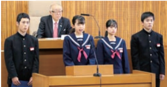
「にぎわいと活力みなぎる町づくり」について発表する赤坂中学校の生徒たち

12月22日、市議会議場に市内の中学校10校から3年生の代表4人ずつが集まり、ふるさと夢会議が開催されました。