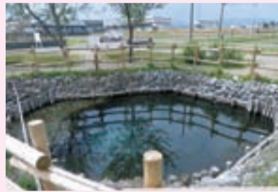
風景資産 ▶北方町がま広場（北方町）