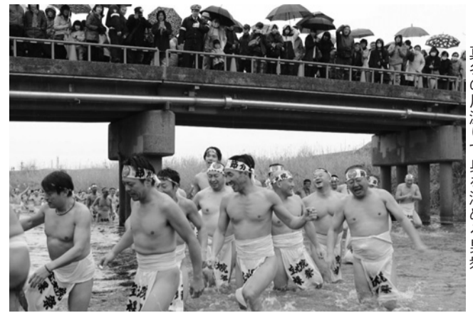
真冬の川渡りて身を清める男衆

「ひだりめ不動」として知られる野口の宝光院で2月3日、厄よけ・開運を願う「節分会はだか祭」が行われました。当日は、下帯姿の男衆108人が、威勢よく掛け声をかけながら水温10度の杭瀬川で身を清め、その後、参拝客の厄を背負う「心男」を担ぎ上げました。そのほか、境内では豆打ち式なども行われ、開運にあやかりとたくさんの人たちでにぎわいました。