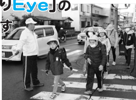
子どもの笑顔を守るやりがいのある活動

市民協働による地域安全活動「さわやかみまもりEye」は、ウォーキングや犬の散歩などを兼ねて、防犯パトロールや児童の登下校の見守りなどを行っています。