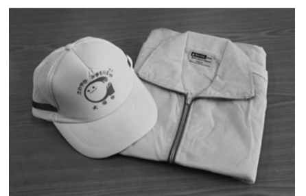
支給される活動グッズ