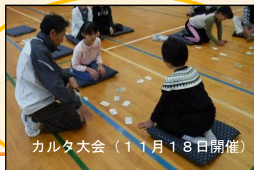
カルタ大会(11月18日開催)