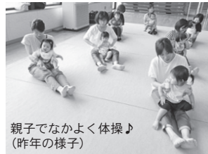
親子でなかよく体操♪ (昨年の様子)