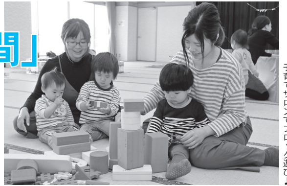
子育てサロンでブロック遊び♪

この機会に、お父さんと郷土の歴史を学んだり、体を動かしたりしながら、親子でふれあう時間を楽しみませんか。