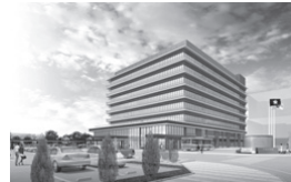
新市庁舎のイメージ

大垣市役所職員等共済会では、令和2年1月に開庁予定の新市庁舎内に設置する食堂の運営を委託する事業者を選定するため、プロポーザル方式により事業者を募集します。