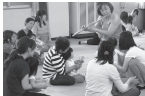
きれいな音色でリズム遊び♪ (昨年の様子)