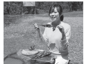
時山の養魚場で釣ったイワナを塩焼きでいただく♪

「水都ピア通信おおがき」月曜15:45~、水曜19:30~、金曜17:15~、土曜23:45~、日曜14:45~ 「水都旅(すいとりっぶ)」を片手に 上石津の大自然を満喫♪ 西濃地域のおでかけに便利な冊子「水都旅(すいとりっぶ)」を持って、お得に上石津の大自然を散策する。