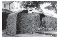
住宅部門最優秀賞(昨年)