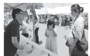
水の味くらべ 昨年の様子