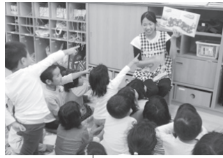
セミナーの様子(昨年)