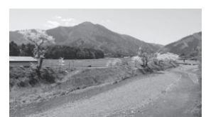
美しい里山が広がる上石津

市は、上石津地域の移住相談会を開催します。この機会に、都会から近い里山の魅力を再発見してみませんか。 当日は、催しいっぱいの「かみいしづ里山マルシェ」も同時開催されますので、ご家族そろってお越しください。 詳しくは、上石津地域事務所地域政策課 (☎45-3113) へ。