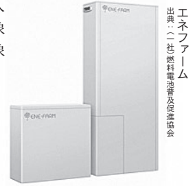
エネファーム