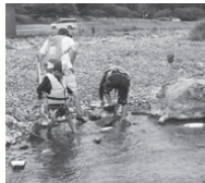
水場のさまざまな生き物を捕まえよう!