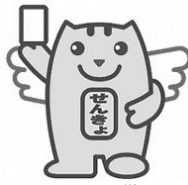
明るい選挙 イメージキャラクター めいすいくん